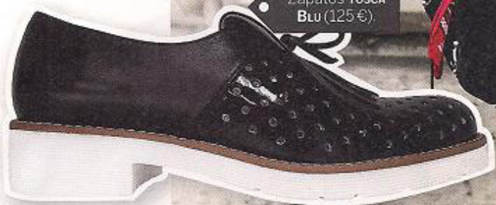
Zapatos TOSCA BLU (125€)