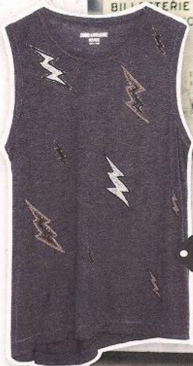
Camiseta ZADIG & VOLTAIRE (198€)

Completa el look con la versión modernizada de los zapatos oxford o de los mocasines. Una reminiscencia de la moda más clásica que aporta un toque especial.