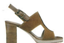
Tamaris , ca. 60 €