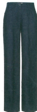
Brax , ca. 100 €