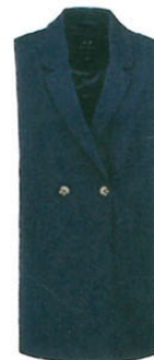
Modström über zalando.de, ca. 130 €