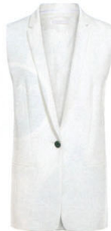
The Mercer über lodenfrey.com, ca. 180 €