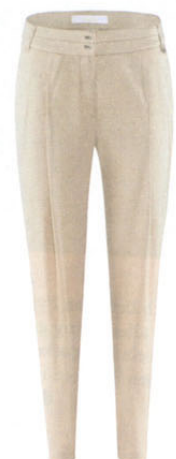
Airfield , ca. 230 €