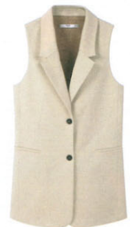
Mango , ca. 50 €