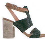
Tosca Blu , ca. 160 €