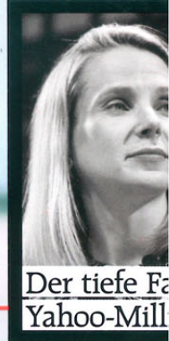
Der tiefe Fall Yahoo-Milli...

Nr. 19 | 4. Mai 2016 Deutschland 2,40 Euro www.grazia-magazin.de