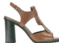
Tod's über mytheresa.com, ca. 535 €