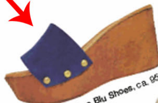
Tosca Blu Shoes, ca. 95 €