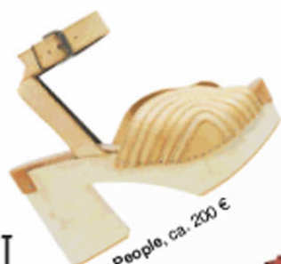
Free People, ca. 200 €