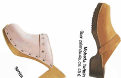
Moheda Toffin (über zafarvoda, ca. 45 €)

Klock, klock, klock. Das ist das Geräusch des Sommers! Warum? Na, weil überall sexy Holzlogs laufen