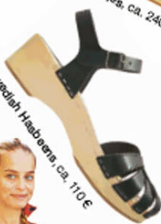
Swedish Hasbeens, ca. 110 €