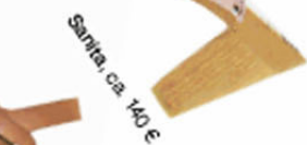
Santa, ca. 140 €