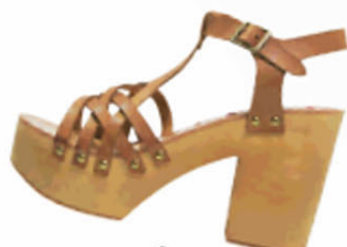
Coolway, ca. 80 €