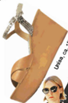
Unisa, ca. 115 €