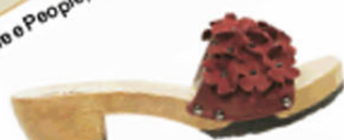
Softdox, ca. 110 €