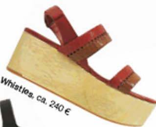
Whistles, ca. 240 €