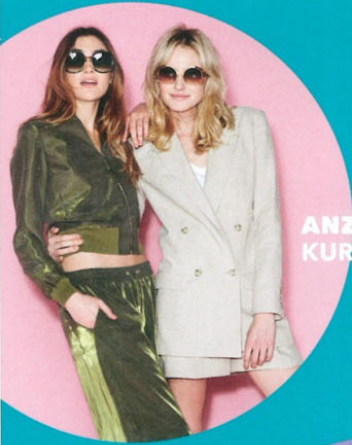
ANZÜGE KURZ & LANG