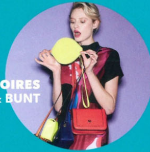
ACCESSOIRES EDEL & BUNT

UND: KLEIDER MÄNTEL RÖCKE JACKEN HOSEN ... ALLE NEUEN LOOKS & STYLES