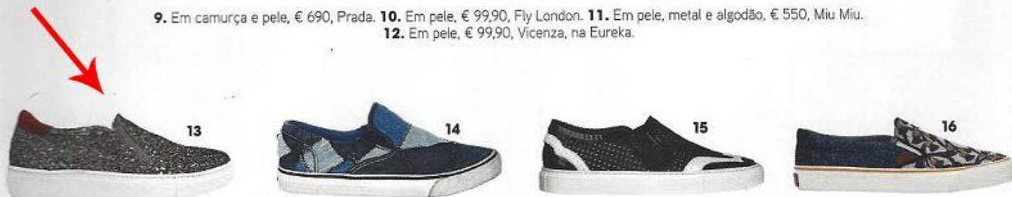
13. Em pele revestida a purpurina e camurça, € 115, Tosca Blu. 14. Em ganga, € 120, Diesel. 15. Em pele envernizada e pele, Givenchy. 16. Em tela de algodão estampada, € 54, Pepe Jeans.