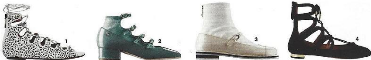
1. Em pele, € 1.270, Azzedine Alaïa, em Net-a-porter.com. 2. Em pele envernizada e pele, Chanel. 3. Em pele envernizada e pele, Chanel. 4. Em camurça e metal, € 535, Aquazzura, em Net-a-porter.com.