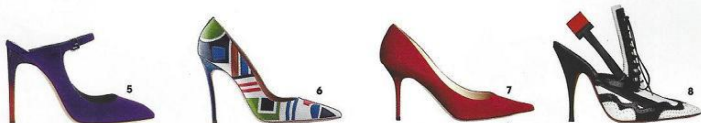
5. Em camurça, Pollini. 6. Em pele envernizada e pele, Dsquared2. 7. Em camurça, €450, Jimmy Choo. 8. Em pele envernizada e pele, € 995, Givenchy.