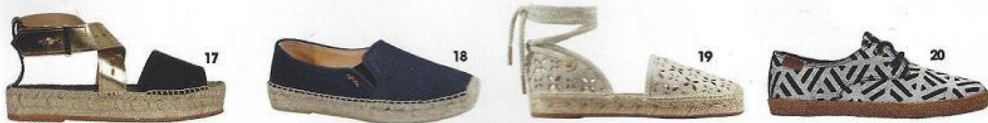
17. Em pele e sisal, Intropia. 18. Em pele e sisal, € 258,70, Longchamp. 19. Em tela de algodão bordada e sisal, € 99,75, Michael Kors. 20. Em ganga estampada e sisal, € 64, Pepe Jeans.