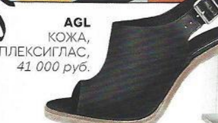
AGL КОЖА, ПЛЕКСИГЛАС, 41 000 руб.