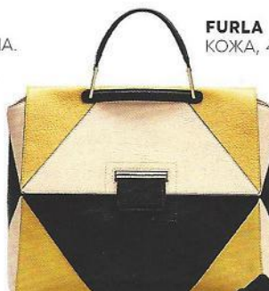
FURLA КОЖА, 46 500 руб.