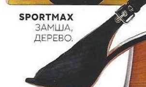
SPORTMAX ЗАМША, ДЕРЕВО.