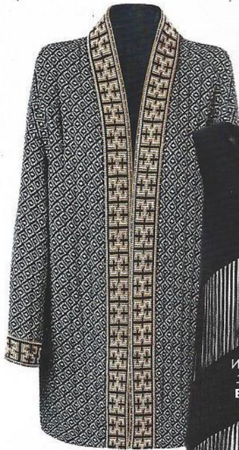
КАРДИГАН ИЗ ХЛОПКА С ПОЛИЭСТЕРОМ, 5 999 руб., MANGO.

Первобытные орнаменты в землисто-песочной гамме – главный этнический мотив сезона.