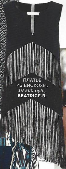
ПЛАТЬЕ ИЗ ВИСКОЗЫ, 19 500 руб., BEATRICE B.