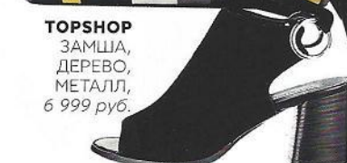
TOPSHOP ЗАМША, ДЕРЕВО, МЕТАЛЛ, 6 999 руб.