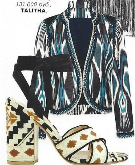
ХЛОПКОВЫЕ БОСОНОЖКИ, 69 000 руб., GIANVITO ROSSI.