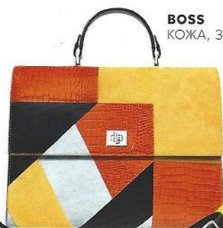
BOSS КОЖА, ЗАМША.