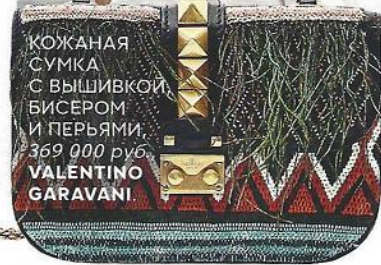
КОЖАНАЯ СУМКА С ВЫШИВКОЙ БИСЕРОМ И ПЕРЬЯМИ, 369 000 руб., VALENTINO GARAVANI.