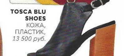
TOSCA BLU SHOES КОЖА, ПЛАСТИК, 13 500 руб.