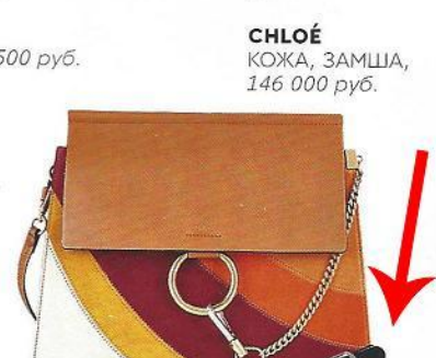
CHLOÉ КОЖА, ЗАМША, 146 000 руб.