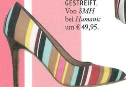
GESTREIFT. Von SMH bei Humanic um € 49,95.