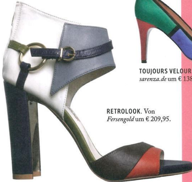
RETROLOOK. Von Fersengold um € 209,95.