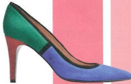
TOUJOURS VELOURS. Bei sarenza.de um € 138,50.