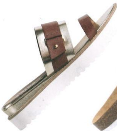
PROFILSOHLE. Von Ted & Muffy um € 140,-.

Dass Schlappen nicht nur was für Ökos sind, wissen wir schon lange. Jetzt gibt das Hipster-Schuhwerk aber so richtig Gas und hüllt sich in Glanz und Glitzer. Das ist nicht nur ein cooler Stilbruch (Casual-Design trifft Glamour-Oberfläche), sondern macht die Treter auch für die Diven unter uns tragbar! Besonders trendy: Modelle mit extradicken Profilsohlen.