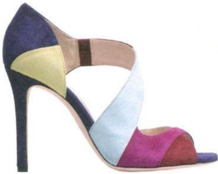
SCHWUNGVOLL. Von LK Benett bei sarenza.de um € 324,99.

Eyecatcher gefällig? Wie wäre es mit den neuen Killer-Colour-Heels? Der ultrahohe Absatz und reichlich Farbe sorgen für ein Statement-Piece der Extraklasse. Tipp: Halten Sie Ihr Outfit schlicht und in dezenten Farben, dann bekommt der Schuh auch den Auftritt, der ihm gebührt!