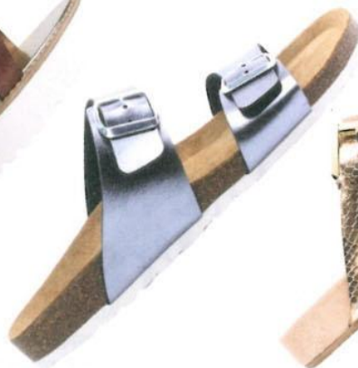
METALLIC. Von Vögele , in ausgewählten Filialen um € 19,90.