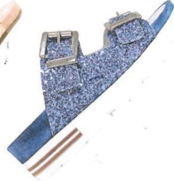
GLITZER-ALARM! Von Tosca Blu um € 114,-.