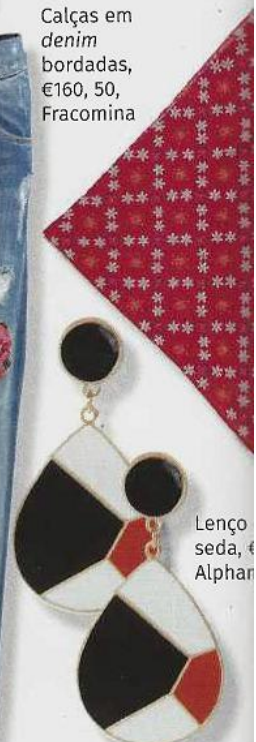
Lenço seda, €160, Alphan