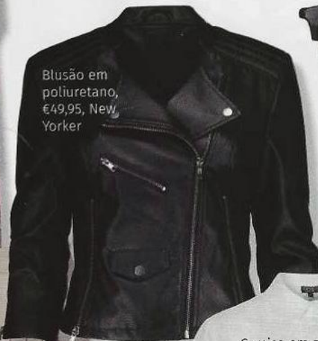
Blusão em poliuretano, €49,95, New Yorker