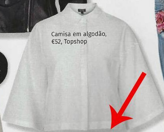
Camisa em algodão, €52, Topshop