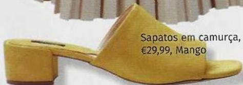
Sapatos em camurça, €29,99, Mango