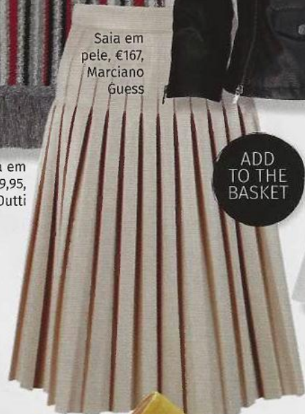
Saia em pele, €167, Marciano Guess