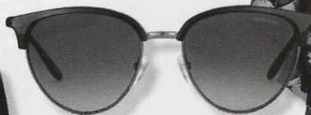
Óculos em acetato, €119, Carrera