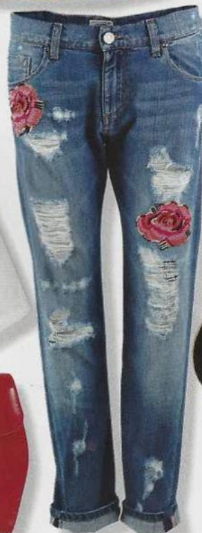
Calças em denim bordadas, €160, 50, Fracomina