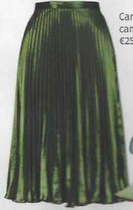
Saia em poliéster, €60, Topshop