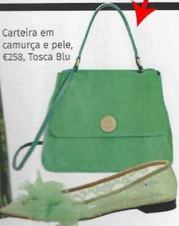
Carteira em camurça e pele, €258, Tosca Blu