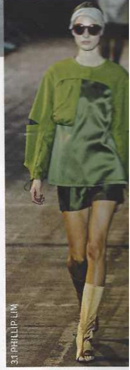
3.1 PHILLIP LIM