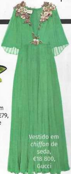
Vestido em chiffon de seda, €18.800, Gucci