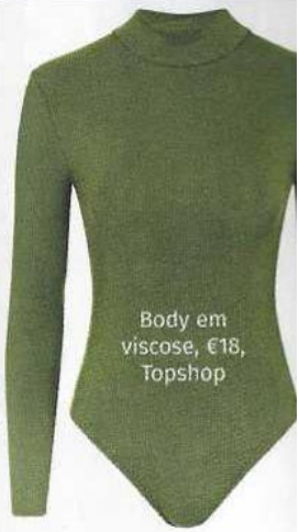
Body em viscoso, €18, Topshop