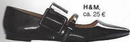
H&M, ca. 25 €