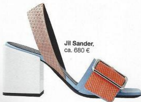
Jil Sander, ca. 680 €

Nein, keine geheime Verschlussache – wir sagen es laut und deutlich: Schnallendetails waren nie so angesagt wie in diesem Jahr. Egal, ob an Schuhen, Handtaschen oder Blusen