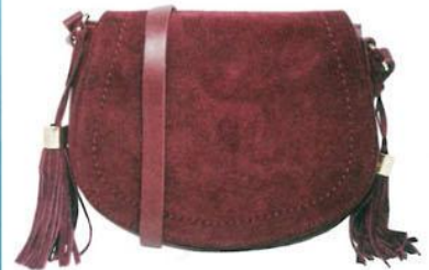
Asos, um 33 Euro.