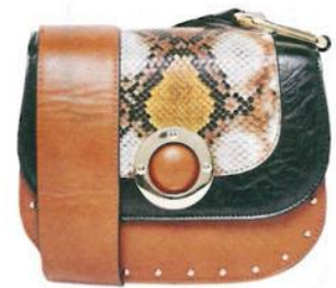
Faith über Nextdirect.com, um 50 Euro.

Die lässige Satteltasche im Seventies-Style erlebt gerade ein großes Comeback! Kein Wunder: Sie ist nicht nur stilvoll, sondern bietet auch genug Platz für die wichtigsten Dinge wie Portemonnaie, Smartphone und Lippenstift. Quer umgehängt ist sie unser neues Must-have für Sommer-Festivals und Open-Air-Konzerte!