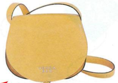
Tosca Blu, um 155 Euro.