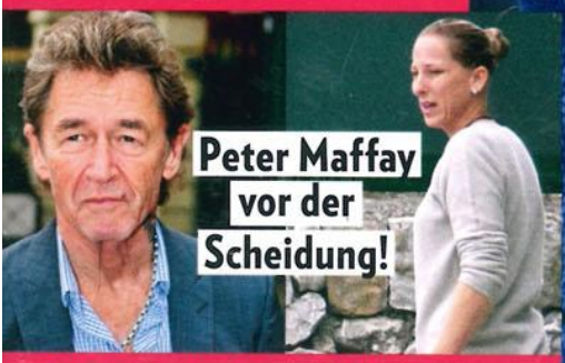
Peter Maffay vor der Scheidung!