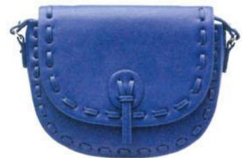
Mango, um 20 Euro.